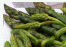
Scarti organici di cucina vegetali cotti