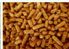
Lettiere vegetali di piccoli animali non carnivori