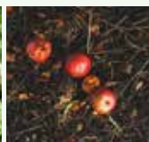
Residui non decomposti del precedente processo di compostaggio